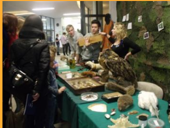
Zielona szkoła: Noc Biologów

Uczniowie naszej szkoły uzyskują każdego roku wysokie wyniki nauczania, osiągają zadowolenie z postępów w nauce.