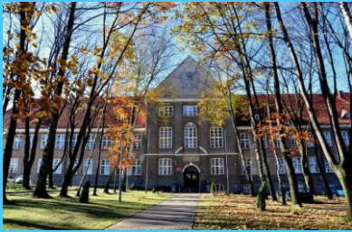
Stylowy i przestronny budynek naszej szkoły