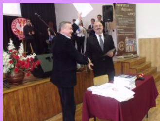
Podpisanie umowy z Instytutem Historii UMCS