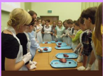
Warsztaty na Akademii Medycznej w Lublinie