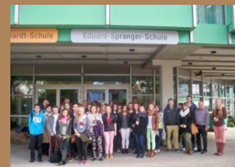
Nasi uczniowie we Freudenstadt