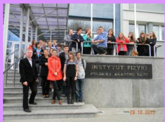
Na warsztatach w Polskiej Akademii Nauk