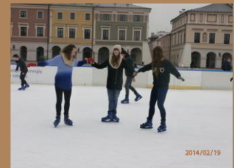
Wyjazd na lodowisko