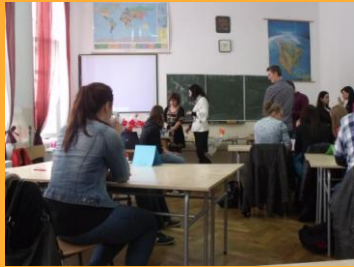
Zajęcia kółka językowego