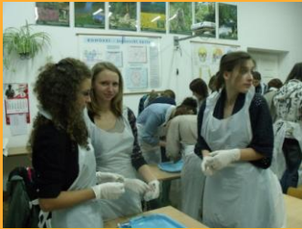
Zajęcia kółka biologicznego