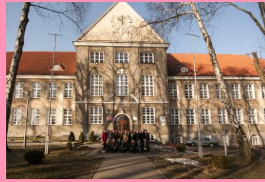
Na zdjęciu klasa II a (średnia w roku 2013/2014 - 4,40)

Uczniowie naszej szkoły uzyskują każdego roku wysokie wyniki nauczania, osiągają zadowolenie z postępów w nauce.