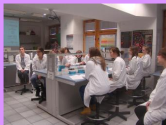
Zajęcia w Instytucie Chemii UMCS